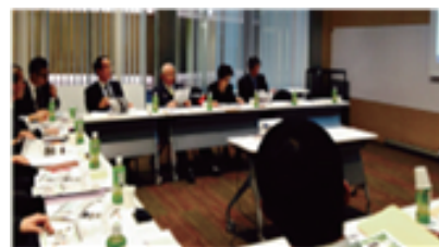
昨年のプレゼンテーションの様子